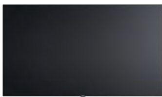
bild i.65 - An* 146,0 / Al 85,8 / PP 6,4 / PT 10,1 bild i.55 - An* 123,6 / Al 73,4 / PP 6,4 / PT 10,1 bild i.48 - An* 107,7 / Al 64,4 / PP 6,4 / PT 10,1 montaje basculante